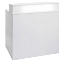
TH 003 Theke, weiß, abschließbar B/T/H 120x66x115cm 250,-€/Stück