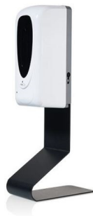
HS 002 Hygienespender, freistehend für Theke oder Tisch 59,-€/Stück