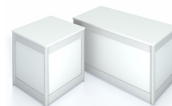
SP 001 Podest 50 B/T/H 50x50x50 cm 33,-€/Stück SP 002 Podest 100 B/T/H 100x50x50 cm 34,-€/Stück