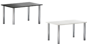
ST 007 Sitztisch eckig, schwarz ST 008 Sitztisch eckig, weiß L/B/H 120x70x73 cm 59,-€/Stück