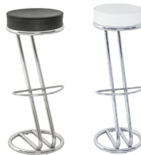
BH 001 Barhocker, chrom Sitz schwarz BH 002 Barhocker, chrom Sitz weiß 41,-€/Stück