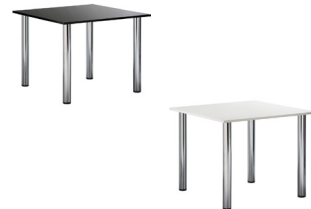
ST 005 Sitztisch eckig, schwarz ST 006 Sitztisch eckig, weiß L/B/H 70x70x73 cm 45,-€/Stück