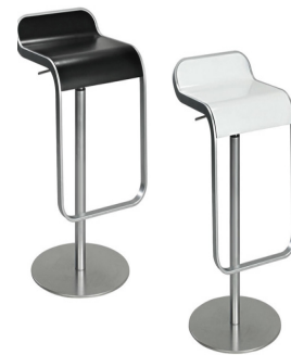
BH 003 Barhocker, chrom matt Sitz schwarz BH 004 Barhocker, chrom matt Sitz weiß 76,-€/Stück