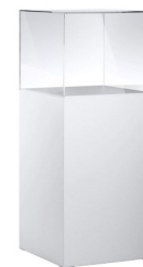
EV 001 Einzelvitrine, mit Glashaube und Strahler, abschließbar B/T/H 50x50x125 cm 246,-€/Stück