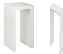
SN 001 N-Stehtisch Höhe 110; 50x50 mm 92,-€/Stück SN 002 N-Stehtisch Höhe 110; 100x50mm 112,-€/Stück