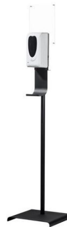
HS 003 Hygienespender, freistehend mit Fuß 99,-€/Stück