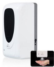
HS 001 Hygienespender, zur Wandmontage 48,-€/Stück