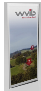
WF 001 Wandplatte, farbig foliert B/T 98,5x30 cm 260,-€/Stück