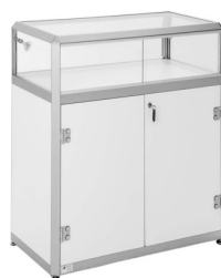
TV 001 Tischvitrine, mit Strahler B/T/H 100x50x104 cm 218,-€/Stück