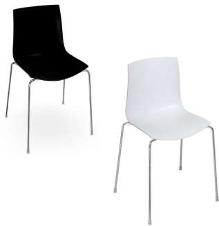
ST 001 Stuhl, schwarz ST 002 Stuhl, weiß 45,-€/Stück