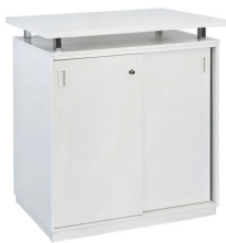
TH 001 Beratertheke, weiß, abschließbar B/T/H 95x50x100 cm 152,-€/Stück