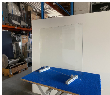
SG 001 Spuckschutz Glas für Theke B/H 100x80x0,8 cm Füße, Alu 49,-€/Stück