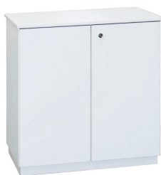
SB 001 Sideboard grau/Alu B/T/H 103x40x84 cm 80,-€/Stück