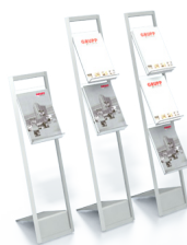
PS 001 Prospektständer, 1 Ablage 68,- €/Stück PS 002 Prospektständer, 2 Ablagen 100,-€/Stück PS 003 Prospektständer, 3 Ablagen 120,-€/Stück