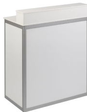
TH 002 Bartheke, weiß/Alu B/T/H 104x63x110 cm 100,-€/Stück