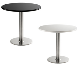
ST 001 Sitztisch rund, schwarz ST 002 Sitztisch rund, weiß Ø 70 cm, Höhe 73 cm 71,-€/Stück