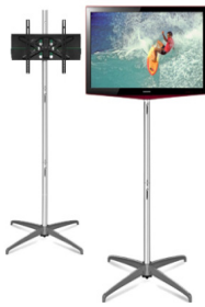
MS 001 Monitor auf Ständer für Monitore 42-56 Zoll 686,-€/Stück